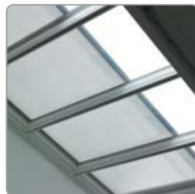
VELUX® modulaire lichtstraat + Topfix® VMS